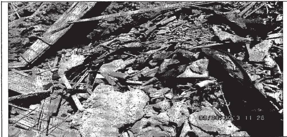
Foto 6. Presencia de residuos peligrosos como recipientes de hidrocarburos y de cemento solvente.