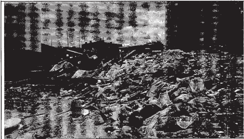
Foto 4. Escombros mezclados con diversos residuos como plásticos, madera, baldes, tubos PVC, PEP, iconos, textiles, cables entre otros